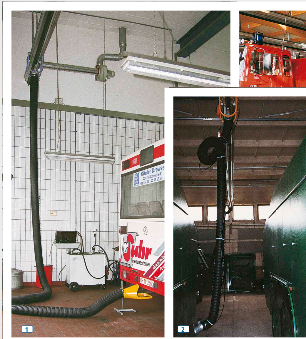
Abb. 1 EXA-Saugschlitzkanal für Busse und Lkw.

Sprechen Sie uns an. Wir sind gewohnt prompt zu reagieren.